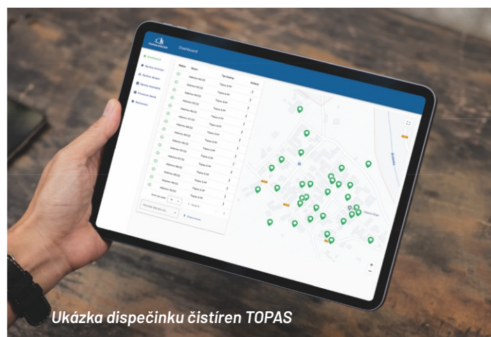
Ukázka dispečinku čistíren TOPAS